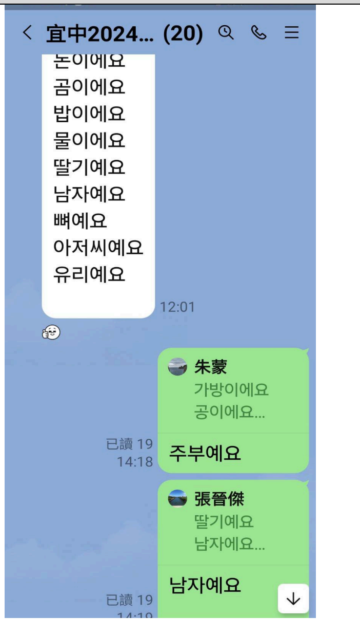
圖片說明：用 line 跟老師討論作業 1