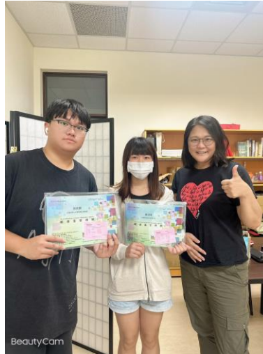
照片說明：同學領取證照