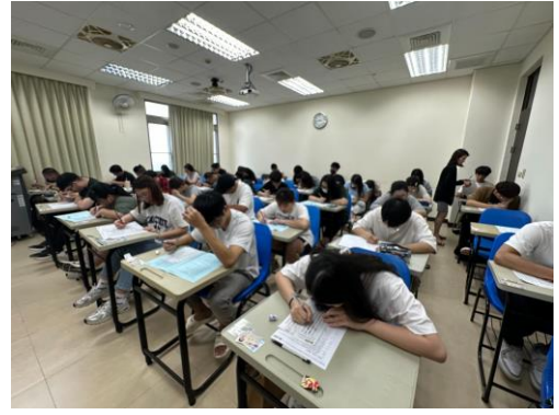
照片說明：證照考試當天