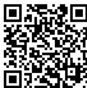
佛光大學交通資訊