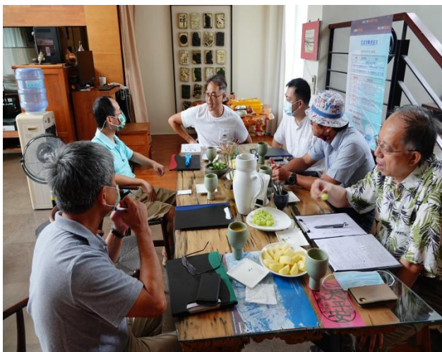
20210924(輕塵別院民宿主人之自我陳述)