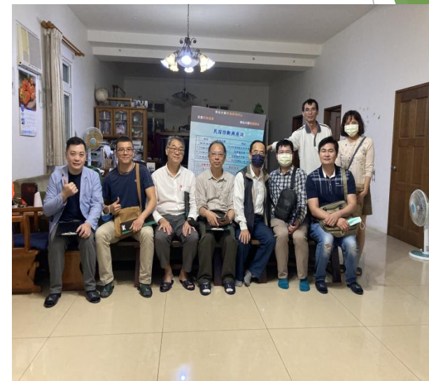
20211119 (顧問和塔塔佳民宿隻外觀造景合影)