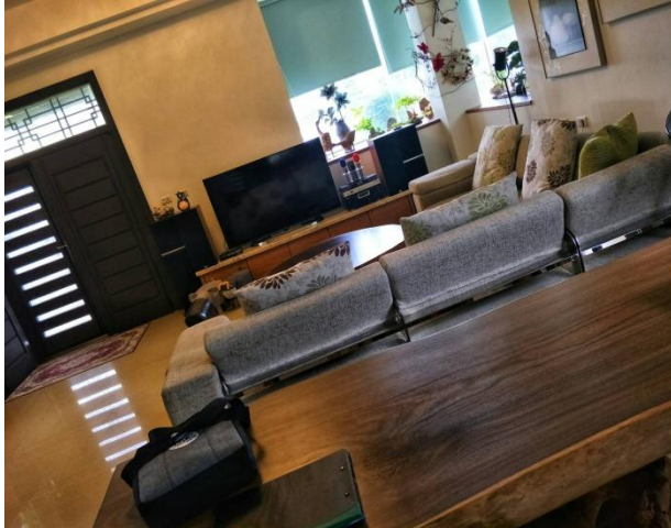
20211029 芙野民宿房務診斷