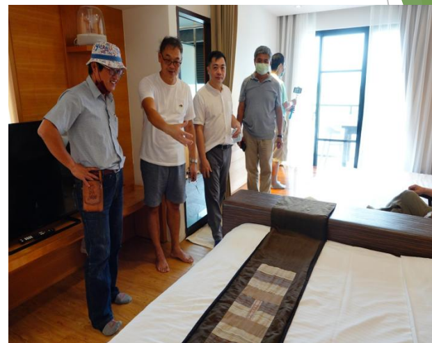
20210924 (顧問對輕塵別院之房務診斷建議)