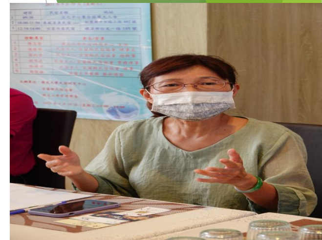
20210929 (禾風彩魚-民宿迎賓櫃台)