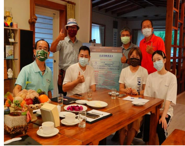
20210924 (優勝美地民宿之音樂特色意象)