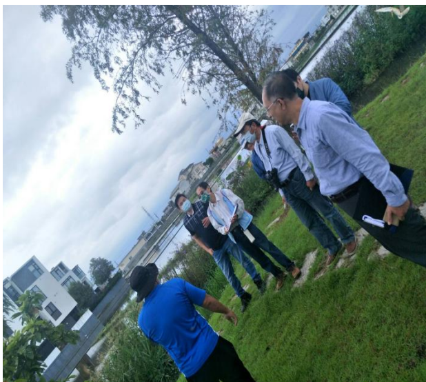
20211029 (羽楓左岸-顧問戶外診斷與建議)