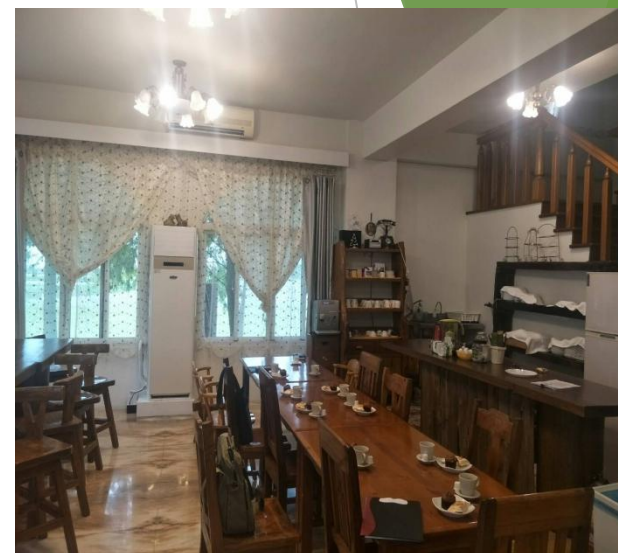
20211029 阿爾卑斯民宿內部裝潢