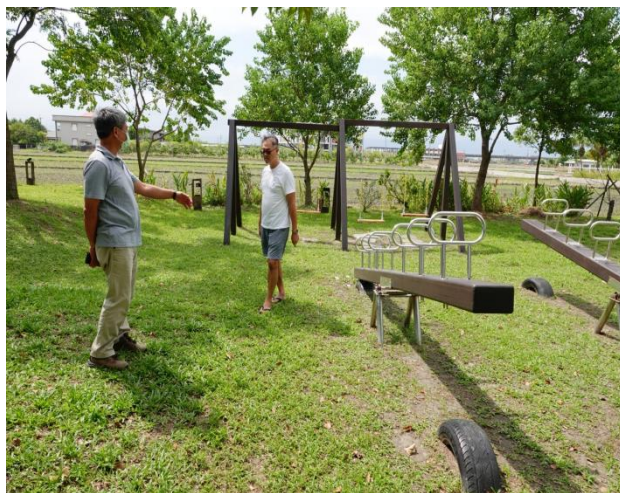
20210924 (顧問對輕塵別院之戶外園區診斷建議)