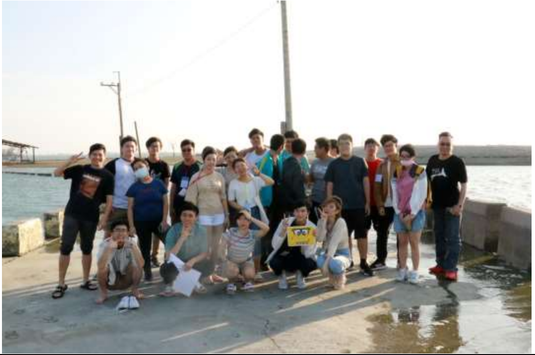
照片說明： 電影消失的情人節片場，到此探查現場和電影中拍攝手法做對比