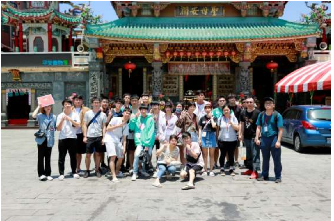
照片說明：安平聖母廟參訪