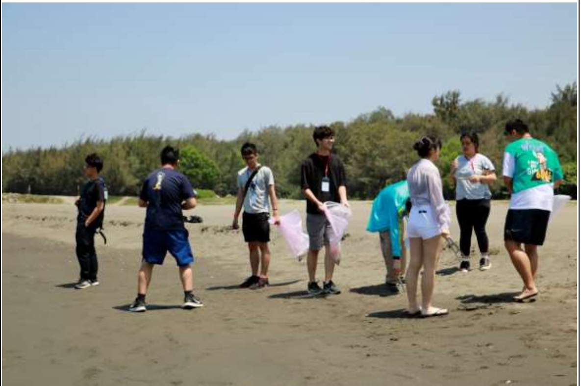
照片說明： 大家在漁光島淨灘，友愛大自然